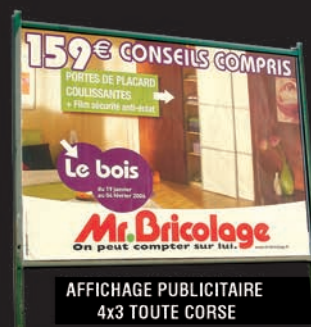
AFFICHAGE PUBLICITAIRE 4x3 TOUTE CORSE