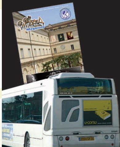
AFFICHAGE PUBLICITAIRE SUR LES BUS AJACCIENS