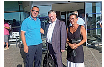
Le président et la trésorière de l'ECA avec un ami de la ligue corse ; Anatoly karpov !! Lors de son arrivée à Ajaccio l'été dernier pour participer à un tournoi de blitz

chemin. J'avais annoncé, en début de saison, le cap des 1800 licenciés pour 2013. Nous étions 1699 fin 2012. Nous sommes, aujourd'hui, 1789 et nous serons, très certainement 1850 d'ici décembre. Cet objectif est réussi. Le seul bémol est que nous manquons de moyens au niveau de la Ligue pour avoir des formateurs supplémentaires dans les écoles de la ville d'Ajaccio afin de créer une émulation encore plus grande.