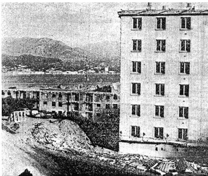
L'ensemble immobilier des « Jardins de l'Empereur » prend maintenant tournure. Plusieurs immeubles sont déjà « sortis » de terre et les travaux de cette importante réalisation sont menés activement.

Déjà, les travaux de quelques bâtiments sont déjà bien avancés et l'entreprise qui a la charge de l'exécution de ce beau projet met les bouchées doubles pour que les « Jardins de l'Empereur » deviennent une réalité.