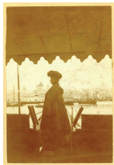
L'Impératrice Eugénie à bord du Thistle

L'exposition temporaire du Palais Fesch a pour objectif de mettre en valeur cette personnalité riche mais pourtant méconnue du Second Empire. À travers une série d'une centaine de photographies ainsi que d'effets personnels de l'Empereur, de l'Impératrice et du Prince Impérial, l'exposition retracera l'intimité de la vie de la famille impériale depuis le Palais des Tuileries jusqu'à l'exil anglais de Chislehurst et la villa Cynros du Cap Martin.