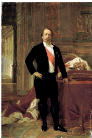
Portrait de Napoléon III Alexandre Cabanel Palais Fesch-musée des Beaux-Arts

Pendant plus de quinze ans, Jean-Baptiste Franceschini-Pietri est l'homme