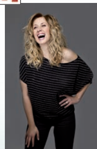
Lara Fabian 13 novembre U Palatinu

Découvrez notre site internet inpiazza.fr www.marche-et-bergerie.com