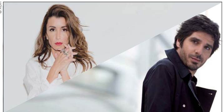
JENIFER ET PATRICK FIORI MARRAINE ET PARRAIN DE L'ASSOCIATION