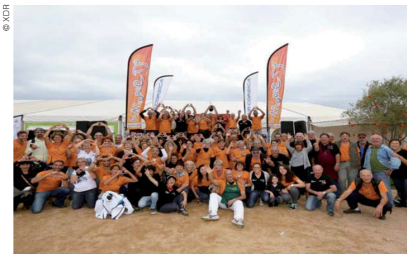
LES BÉNÉVOLES DE LA MARIE-DO

sains et saufs et les blessés guéris, notre association se remobilise pour reprendre le combat contre la maladie et les aides aux malades. Le commando 100% bénévole de LA MARIE DO, soutenu par une marraine et un parrain formidables, des artistes généreux et des partenaires remarquables, a retravaillé d'arrache pied pour mettre au point un nouveau programme spécial sur 24 heures : Les 24 heures de la Solidarité !