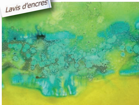
Exoplanètes Odile Pierron Lavis d'encres