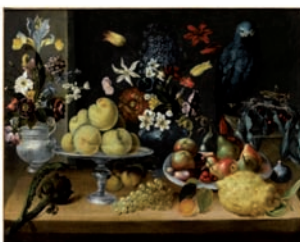
Anonyme actif à Rome au début du XVII e siècle Nature morte de fleurs, fruits et perroquet Huile sur toile 57 x 75 cm MFA 852.1.515