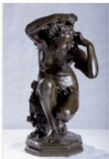
Jean-Baptiste CARPEAUX Flore accroupie Bronze 52 x 31 x 29 cm MFA 965.1.1

Le projet comprend également des œuvres empruntées à d'autres musées des Beaux-Arts, institutions parisiennes et d'autres FRAC(s), institutions partenaires de l'opération. Cette exposition est aussi l'occasion de présenter pour la première fois en Corse des œuvres de Pablo Picasso, ce qui constituera un événement de premier ordre.