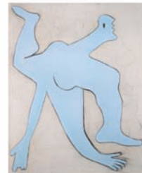
Pablo Picasso L'Acrobate bleu Novembre 1929 Fusain et huile sur toile 162x130 cm Musée national Picasso – Paris Dation Pablo Picasso, 1990. MP1990-15 © Succession Picasso 2018