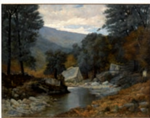
Alfred de la ROCCA Rivière de Cristinacce en octobre Huile sur toile 152 x 204cm MFA/D 912.2.1