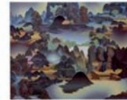
Christian HIDAKA Factory Mountains (2012) Huile sur toile de lin 207,5 x 250 cm Collection FRAC Corsica Acquisition 2013 N°3/07.13/P