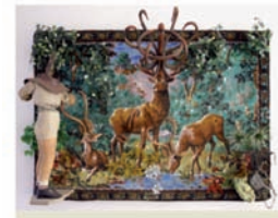
Daniel Spoerri Der Hirschhirte/Le Bon Pasteur II , 1992 Collection FRAC Corsica