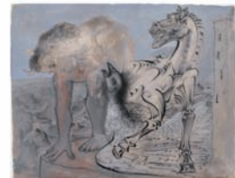
Pablo Picasso Faune, cheval et oiseau 5 août 1936 Gouache, plume et encre de Chine sur papier aquarelle épais 44,5 x 54,5 cm Musée national Picasso-Paris Dation Pablo Picasso, 1979. MP1170