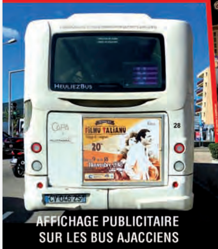
AFFICHAGE PUBLICITAIRE SUR LES BUS AJACCIENS