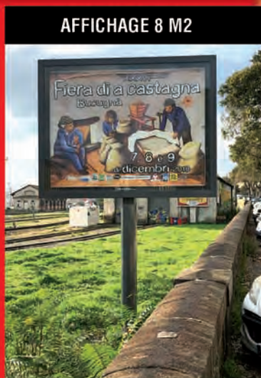
AFFICHAGE 8 M2