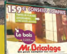
AFFICHAGE PUBLICITAIRE 4x3 TOUTE CORSE