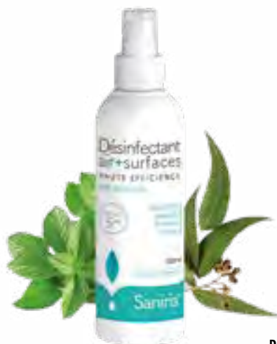
Désinfectant air + surfaces 40% alcool