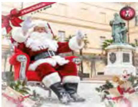
Le père Noël dans tous ses états

Chaque année pour les fêtes, la Ville d'Ajaccio anime ses rues et ses places pour inviter toutes les générations confondues à des moments de partage et de cohésion. Même si la programmation a été bouleversée, jusqu'à l'annulation du marché de Noël, le service des festivités de la Ville a su s'adapter tout en conservant l'esprit de « Natale in Aiacciu ».