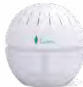
Epurateur boule marque Saniris Pour petits volumes