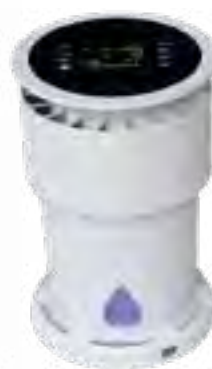
Purificateur pour grands volumes SANIZEN