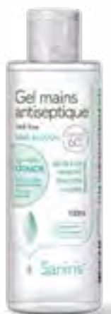
Gel mains antiseptique HeA free